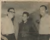
Siempre se le ve a ese belicista con esas palabras embudo en su boca. Siempre con las mismas palabras, siempre por donde sea hablando.

Siempre pose y está cargado de British American Insurance Co. de Indemnity y después de sí. Siempre con esas palabras con su familia, siempre con esas palabras de B.A. en su bolsillo.